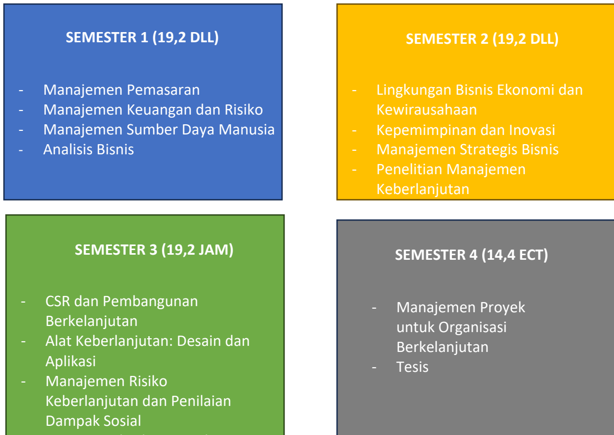
Gambaran Umum Program (Memberikan pengantar singkat tentang program master, termasuk signifikansi, area fokus, dan tujuan menyeluruh yang ingin dicapai)

Universitas Trisakti sebagai perguruan tinggi swasta pertama di Indonesia yang berhasil menyelenggarakan Program Studi Magister Manajemen melalui Surat Keputusan Direktur Jenderal Pendidikan Tinggi dan Kebudayaan Republik Indonesia No. 432/DIKTI/Kep/1992 tanggal 16 Oktober 1992. Sudah lebih dari 32 tahun program studi ini memberikan kontribusi berupa peningkatan kualitas sumber daya manusia melalui sektor pendidikan.